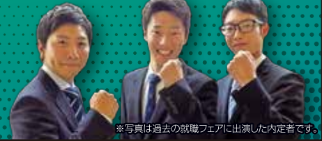
※写真は過去の就職フェアに出演した内定者です。