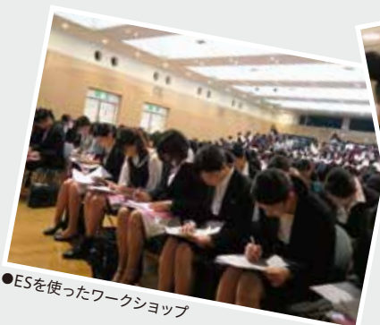
●ESを使ったワークショップ