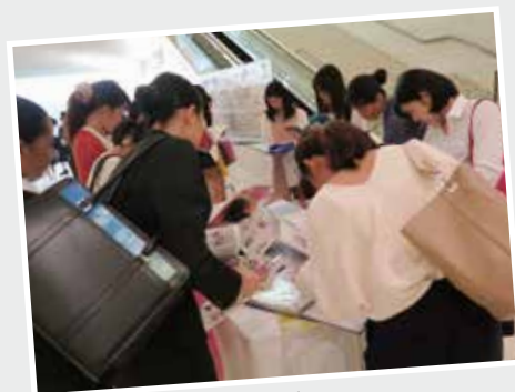
●内定者の就活ノート展示コーナー