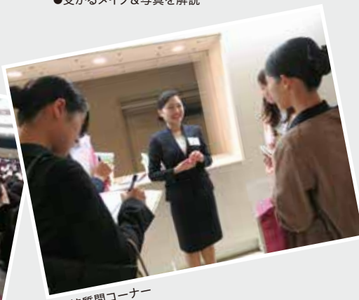
●直接質問コーナー