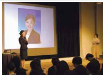
●受かるメイク&写真を解説