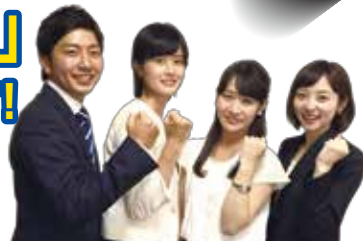
※写真は過去の就職フェアに出演した内定者です。