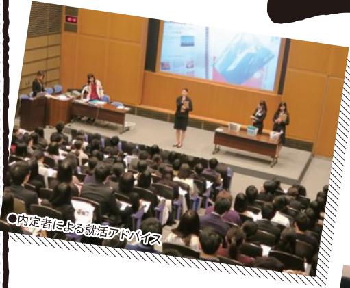
○内定者による就活アドバイス