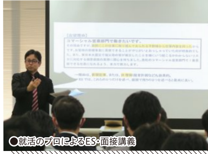
○就活のフローによるES・面接講義