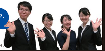
※写真は過去の就職フェアに出演した内定者です。