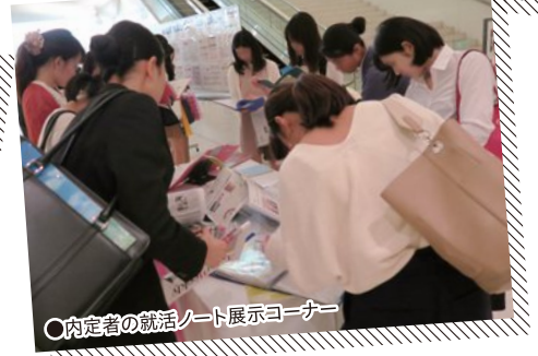
○内定者の就活ノート展示コーナー