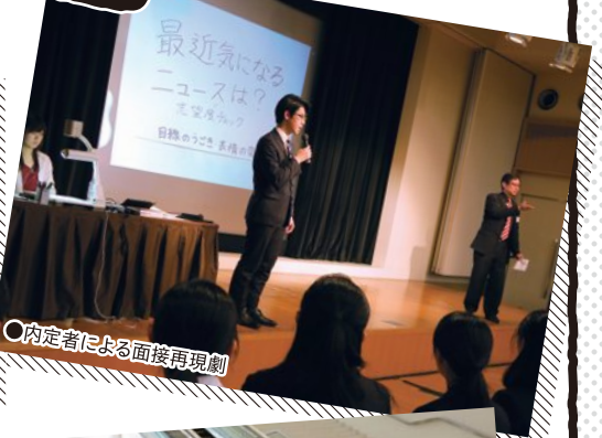
○内定者による面接再現劇