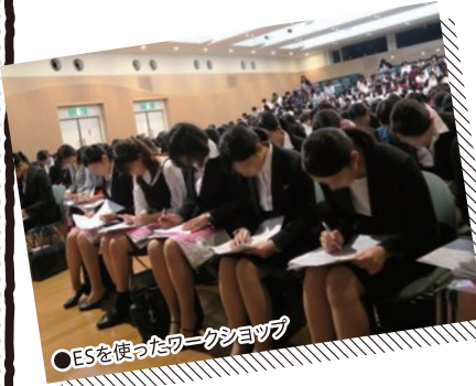
○ESを使ったワークショップ