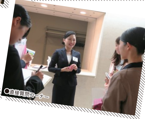
○直接質問コーナー