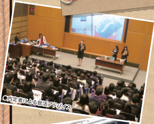
○内定者による就活アドバイス