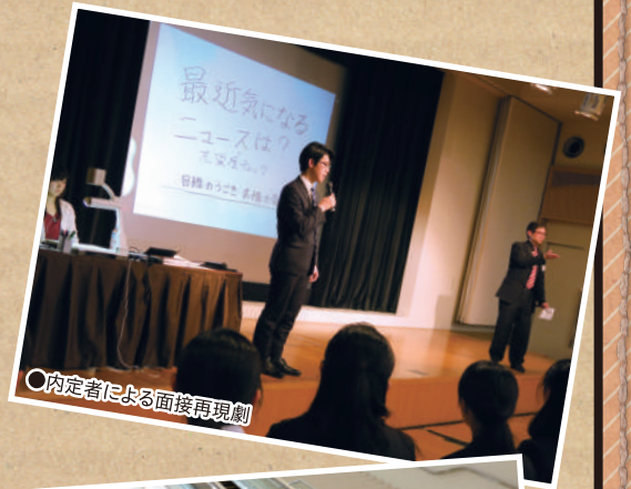
○内定者による面接再現劇