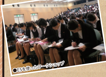
○ESを使ったワークショップ