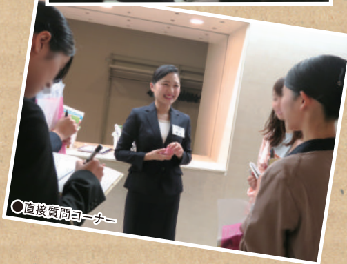
○直接質問コーナー