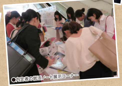
○内定者の就活ノート展示コーナー